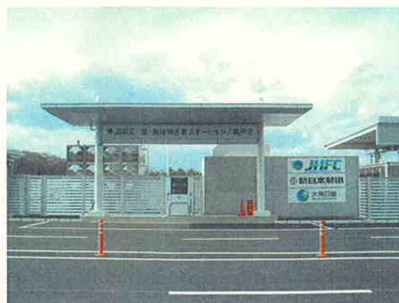
愛・地球博水素ステーション／瀬戸北