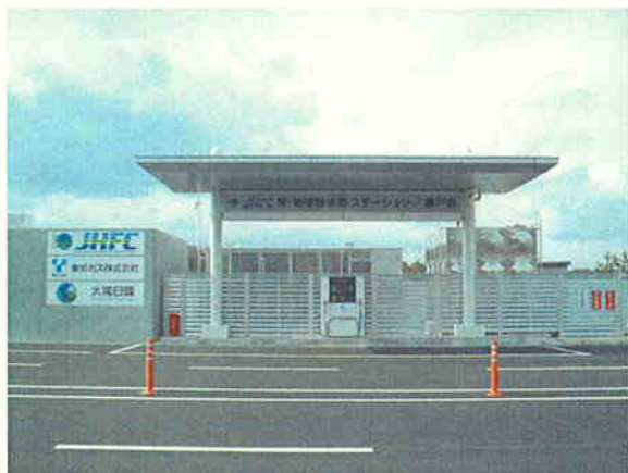
愛・地球博水素ステーション／瀬戸南