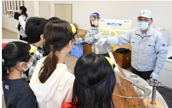
超電導コースターの実験