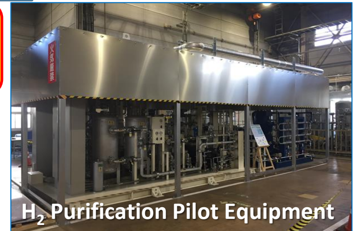
H 2 Purification Pilot Equipment