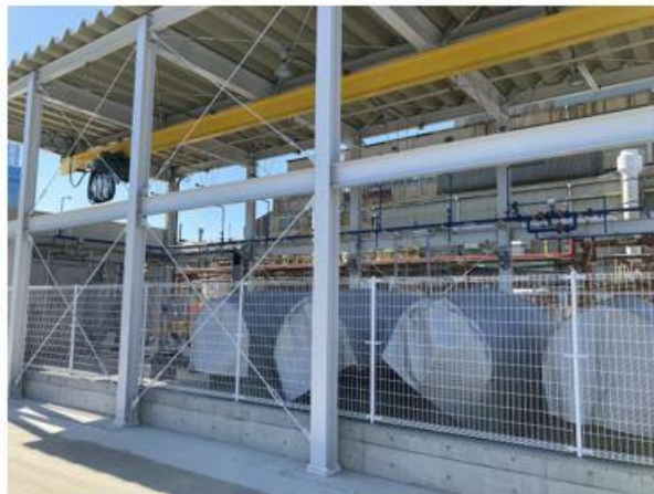
Fig. アンモニア燃料の貯蔵タンク