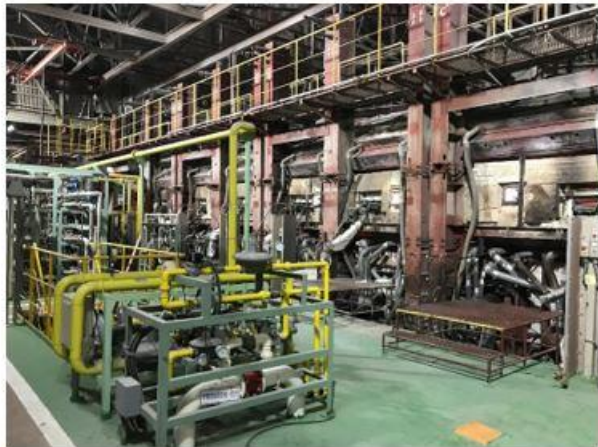
Fig. 今回実証試験を行ったガラス溶解炉